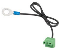
Złącze z fabrycznie zamocowanym ujemnym przewodem prądu stałego (w zestawie)